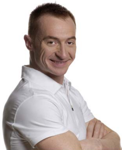
JURY CHECHI PER IL TERZO ANNO CONSECUTIVO TESTIMONIAL DELLA GIORNATA NAZIONALE PARKINSON